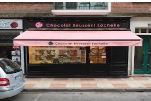
Chocolaterie de BEUSSENT-LACHELLE