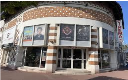
Cinéma LE MORNY

Sur présentation de votre carte d'adhérent