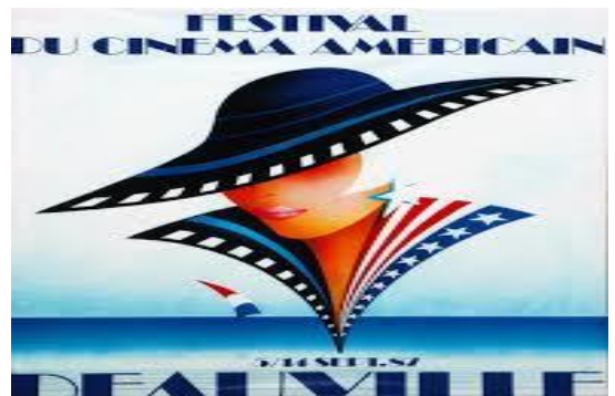
Festival du Film Américain de Deauville