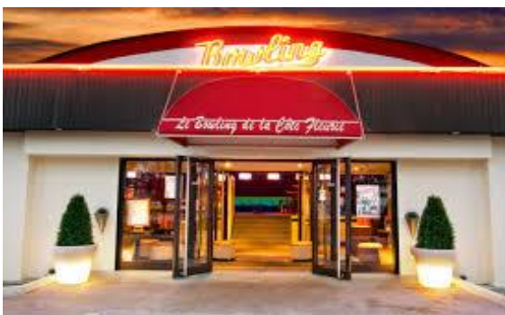
Bowling de Deauville