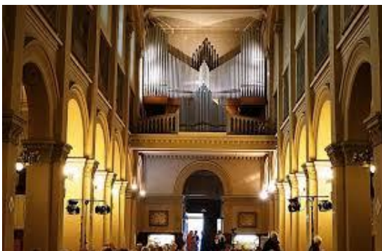
Les Amis de L'Orgue